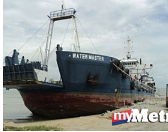
Buaya dilihat dekat jeti

( http://www.hmetro.com.my/node/55261 ) ( http://www.hmetro.com.my/node/57777 )