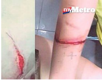
Mat rempit tetak payudara