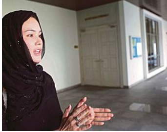
Gugur talak 3

( http://www.hmetro.com.my/node/52913 ) ( http://www.hmetro.com.my/node/30500 )